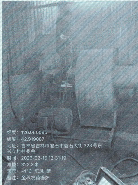
附图 废气现场采样图